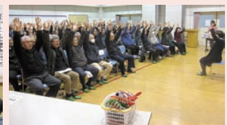
↑音楽に合わせた体操 皆さん終始笑顔でした♪