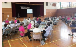
【研修】詐欺被害のDVD鑑賞

今年度は、研修後の会食・交流の時間に民生委員さんや地域のボランティアさんが演芸を披露してくださり、とても和やかな意義ある研修会となりました。