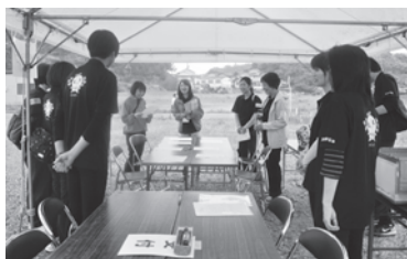
【災害ボランティアセンター設置訓練】 ボランティアの受付、マッチング(派遣調整)、送り出しを行いました。

いつ発生するか分からない災害に備えて、社協では今後も市民の方や関係機関と連携しながら防災意識の向上を図っていきます。