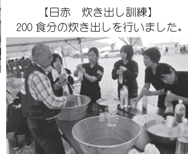
【日赤 炊き出し訓練】 200食分の炊き出しを行いました。