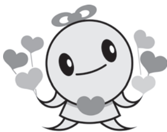
浜田市社協PRキャラクター ふくっぴー