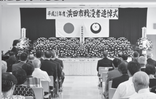
↑ 昨年の式典のようす