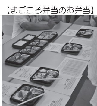
【まごころ弁当のお弁当】