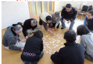
お助けカードゲーム