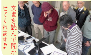
文書を読んだり 音楽を聴いたり させてくれます♪

2月28日(水)、千畳苑において島根県西部視聴覚障害者情報センターより日常生活に役立つ補助具や便利グッズを紹介していただき、会員は手にとり熱心に試していました。