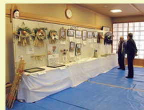
きめ細やかな作業がうかがえる作品が並びました