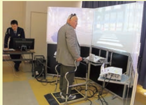
悪天候の道路横断

2月26日(月)、みどり会館において開催しました。浜田警察署、県交通安全協会よりご指導いただき認知症検査、機械を使い様々な模擬体験を会員一同、熱心に取り組んでいました。