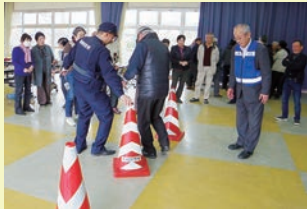
飲酒状態での歩行状態