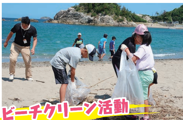
ビーチクリーン活動