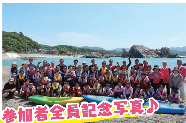
参加者全員記念写真♪

8月7日(火)、三隅町の田ノ浦海水浴場及び三保公民館において開催し、市内の小学校4年生から6年生の児童47名が参加しました。