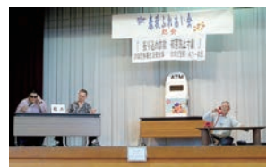
犯人役は警察のお二人!

今回の研修会のような怪しい電話には気を付けて、次回は秋の日帰り研修旅行でお会いしましょう♪