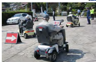
【電動車操作講習】 左右も見て安全確認!