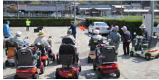
11名の方に参加いただきました♪

電動車の操作では、多くの方が後方確認や、後進が苦手なようです。注意して運転しましょう!