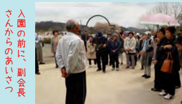
入園の前に、副会長さんからのあいさつ

高齢者クラブでは、年間を通じて魅力ある活動を展開しています。未加入の方で、一緒に活動してみたい方はぜひ事務局(電話:32-1831)にご連絡をお願いします。