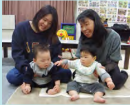
おやつもみんなでいただきます♪

今年度も毎月第2木曜日に、さんあいホームで子育てサロンを開催します♪ ママ、パパ、じいじ、ばあば、待ってます♪