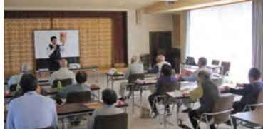
特殊詐欺防止の啓発やDVによる交通ルール・マナーについて学びました。