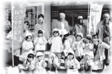
→ 【街頭募金活動】 キヌヤ金城店