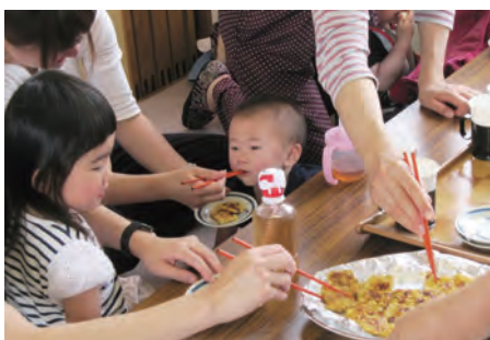
美味しかったかな? この日は、お好み焼き風おやつを食べました♪

日頃の子育ての悩みなどを話し合ったり、少しでも子育てが楽しくできることを願い、ふれあいすくすくサロンを毎月第3水曜日に開催しています。子育て中のお母さん・お父さん、孫育て中のおばあちゃん・おじいちゃん、妊婦さんの参加をお待ちしています♪