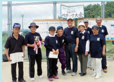
美又チームのみなさん♪

練習を積んだチームや、初心者を含めたチームなど、さまざまでしたが大会の目的である健康維持増進と相互の親睦は十分に図ることができました。