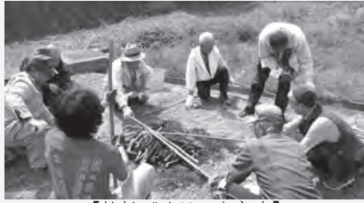
【竹杖づくりのようす】

5月に行われた、高齢者クラブ連合会弥栄支部と弥栄町有志の方々による支え合いの地域づくりを紹介します♪