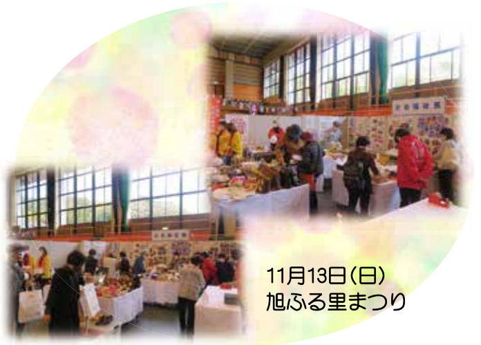
11月13日(日) 旭ふる里まつり