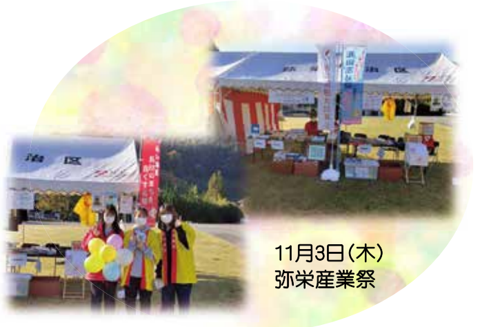
11月3日(木) 弥栄産業祭