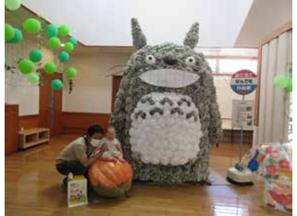
大蛇は子どもに大人気！ 広いホールがいっぱいに