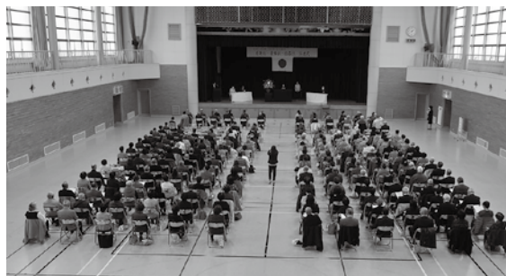
12月4日(日) 伝達式の様子