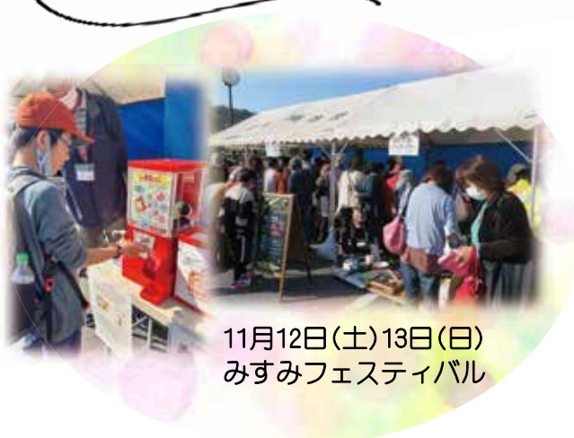
11月12日(土)13日(日) みすみフェスティバル

コロナ禍により3年ぶりに各地でイベントが開催され、社会福祉協議会もバザーや募金活動等で参加しました。ご協力いただきました皆さまありがとうございました。