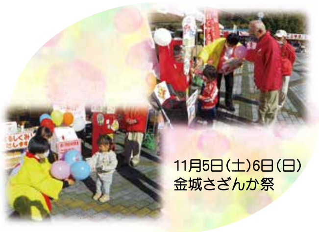
11月5日(土)6日(日) 金城さざんか祭