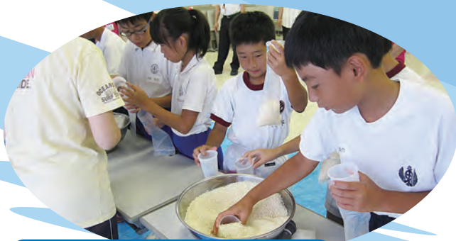
災害時の炊き出し体験・試食

8月5日(火)、51名参加のもと開催。みんなで炊き出し体験を行った後、「車いす体験」「手話を知ろう」「赤ちゃんふれあい体験」の中から、自分で選んだ体験学習で学びを深めました。