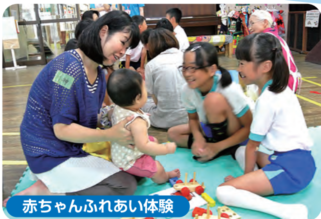
赤ちゃんふれあい体験