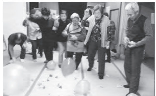
↑豆まき(節分)の様子

平成16年から月2回、レクやゲーム・誕生日会・昼食会など楽しい企画で開催されています。ボール体操やまめなくん体操も盛んで、健康作りにも励んでおられます。