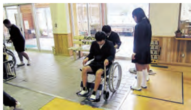
段差があると車いすは大変です

弥栄小学校6年生を対象に「公民と福祉」と題してお話し、実際に体験してみました。住民の意見・要望から実現した福祉、思いやりが身近なところにもたくさんありました。地域の思いやりをいつまでも忘れないでほしいと思います。