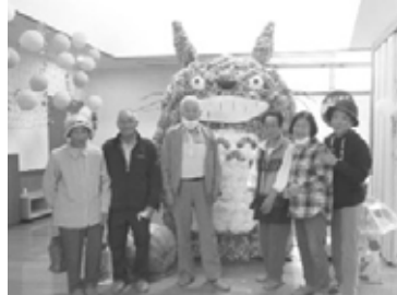
▲来て見てなんでも作品展 (金城)