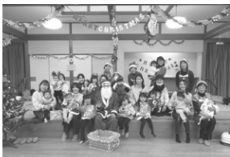
子育てサロン クリスマス会 (金城支所)

共同募金は、少しでもじぶんの町を良くしようというみなさまの意志を具体的な活動やモノにつなげていく、「じぶんの町を良くするしくみ」です。これからもご理解とご協力をお願いいたします。