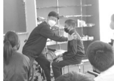
▲介護の基礎的講座 (旭)