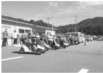
▲高齢者安心・安全生活推進事業 (弥栄)