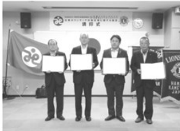
▲災害時におけるボランティア支援に関する協定

昨年度、本会では、第3次浜田市地域福祉活動計画のビジョン「安心して暮らせる『我が家』のような地域づくり」を目指し、「人と人とのつながり」や「他者への寄り添い」の大切さを伝える取り組みを進め、地域の課題を「我が事」として関心を高める啓発を行い、市民の皆さまをはじめ、福祉団体や関係団体等多くの方々の参加と協力をいただき、さまざまな活動に取り組みました。