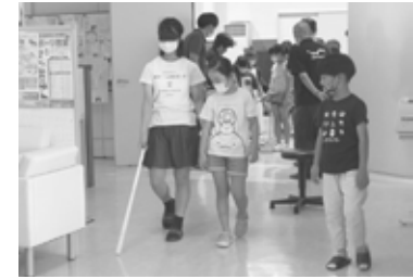
▲夏休み子どもボランティア講座 (三隅)