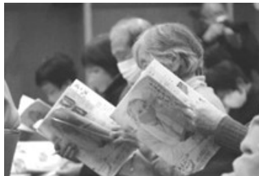
▲ゆるやかなつながり大発表会