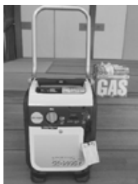
キャリーケース型で持ち運びが容易。誰でも使える発電機です。