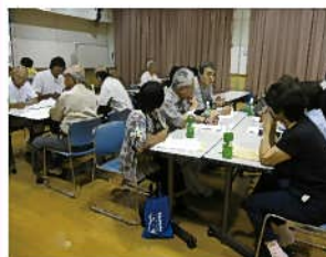
三隅地域 6月26日(金) 於：三隅公民館

福祉委員さんと民生委員さんは地域に身近な福祉活動の『要』として、地区社協や社会福祉協議会等と連携し、心通う温かい地域づくりに向け、活動していただいています。