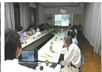
井野地域 7月19日(木) 於：井野公民館