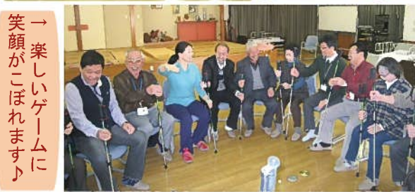
→ 楽しいゲームに笑顔がこぼれます♪