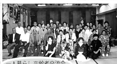
一人暮らし高齢者交流会