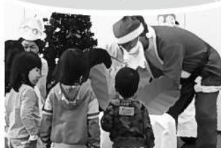
子育てサロン（クリスマス会）