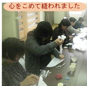
心をこめて縫われました

会員さんの中には、雑巾を縫う作業が難しい方もおられたようですが、縫う以外の作業を一緒にされ、みなさんで心をこめて作られています。