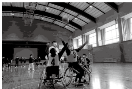
障がい者との車いすバスケット