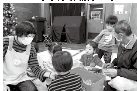
石見地区子育て広場のようす