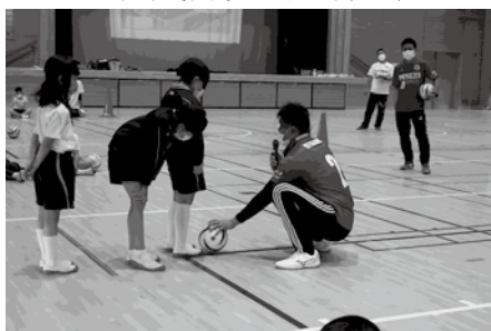
ブラインドサッカーのようす