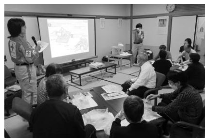
▲防災セミナーの様子

昨年度、浜田市地区では会費・寄附金 9,555,300円 をご協力いただきました。今年度も日本赤十字社の活動についてご理解いただき、引き続き皆さまのご協力をお願いいたします。