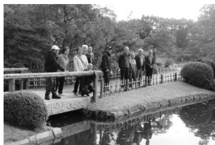
▲一人暮らし高齢者交流事業【金城】