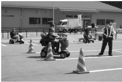
▲電動車講習会【弥栄】