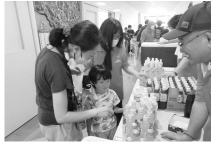
▲みすみっ子集まれ!!【三隅】