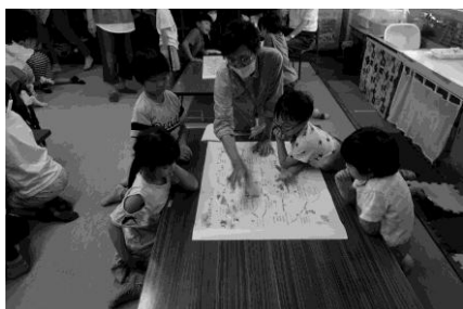
▲見守り・見守られのコラボ学習