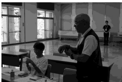
▲ボランティア養成講座