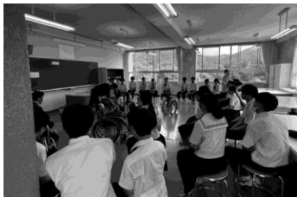
▲介護の基礎的講座【旭】